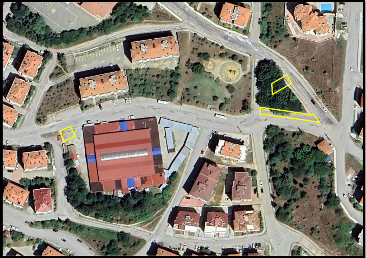
Şekil 1: Planlama Alanı Uydu Görüntüsü

Planlama alanı, Sinop Belediyesi, Zeytinlik Mahallesi sınırları içerisinde yer almaktadır. Tescil harici alanlarda yer almaktadır. Plan değişikliğine konu tescil harici alan Aşyan Pazar Yeri içerisinde ve meri imar planında park olarak planlanmış alanlardır. Ulaşım Kıvrık Sokak ve Barış Sokak ile çevre imar yolları üzerinden sağlanmaktadır. 1/1000 ölçekli halihazır haritada D34-D-24-D-2-A numaralı paftadadır. ITRF-96 koordinat sisteminde Y:430940-430950, X:4654330-4654350 ve Y:431100-431150, X:4654350-4654400 koordinat değerleri arasındadır.